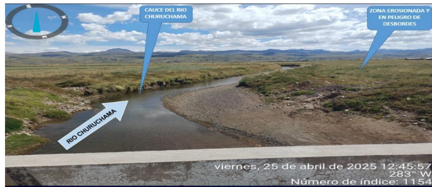
FIGURA 1 y 2 : TRAMO CRÍTICO EN EL RÍO CHURUCHAMA, EN EL SECTOR ORCOHUAYTA, DISTRITO DE LAMPA, PROVINCIA DE LAMPA - PUNO. NOTESE, LA ACUMULACIÓN DE MATERIAL SEDIMENTADO EN EL CAUCE, QUE REQUIERE SER ELIMINADO PARA REESTABLECER LA SECCION HIDRAULICA DE LA CAJA DEL CAUCE EN ESTE SECTOR.